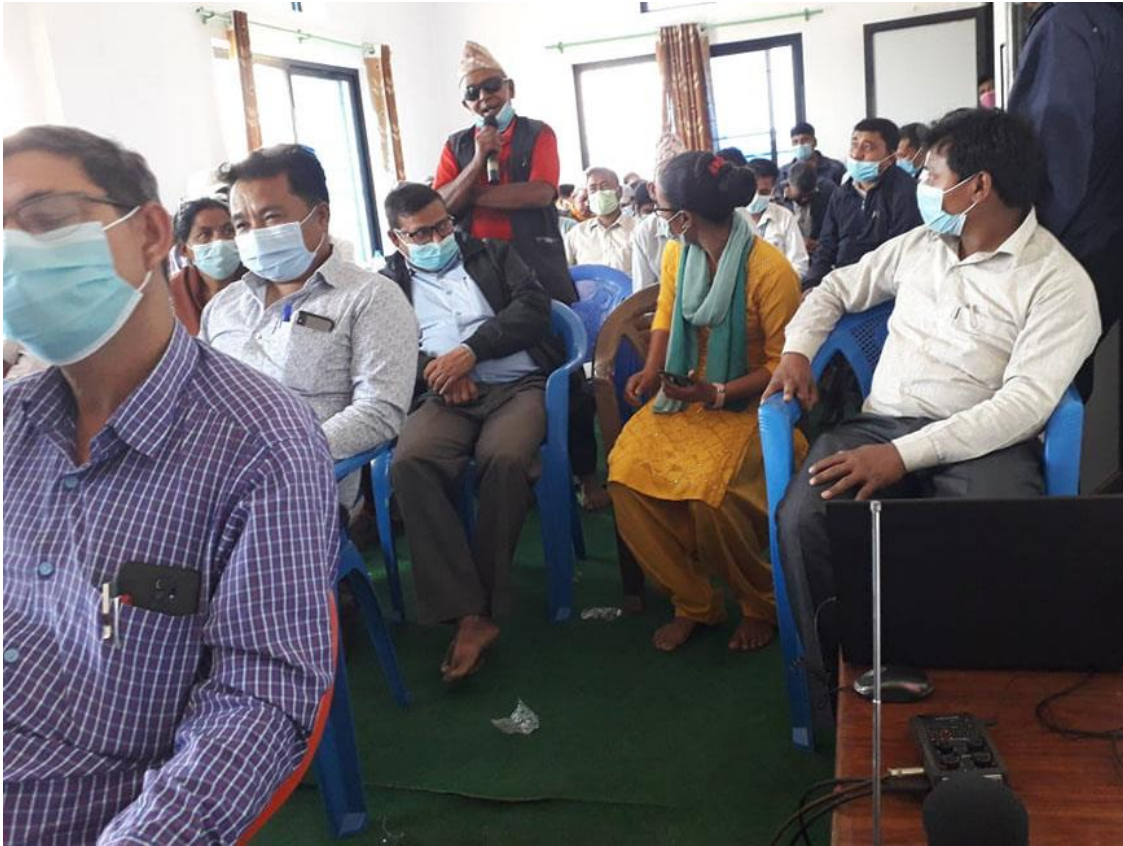
सार्वजनिक सुनुवाईका सहभागीहरु